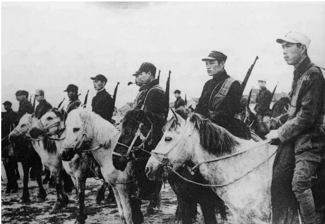
整装待发的新四军骑兵团指战员

1941年8月1日，新四军第四师骑兵团在淮宝县（今江苏省洪泽区）岔河镇成立。作为新四军唯一的一个团级骑兵部队，骑兵团在彭雪枫师长的领导下屡建奇功，迅速发展壮大成为纵横驰骋于淮北大地的抗日精锐之师。彭雪枫师长称之为“红色哥萨克”。