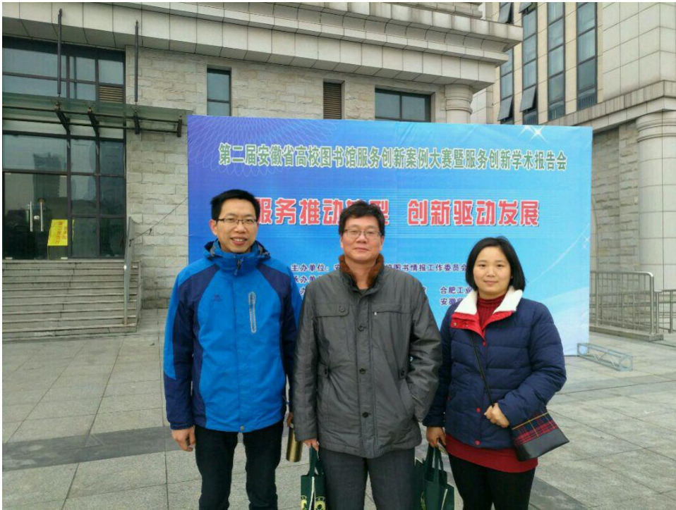
安庆师大图书馆参会人员在安徽农业大学图书馆合影

由安徽省高等学校图书情报工作委员会主办，安徽农业大学图书馆承办，中国科学技术大学图书馆、合肥工业大学图书馆、安徽大学图书馆、安徽师范大学图书馆协办的“第二届安徽省高等学校图书馆服务创新案例大赛”于11月24-26日在安徽农业大学隆重举行。