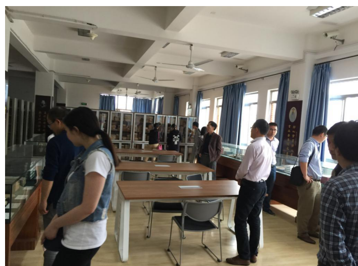
(教师和学生代表参观图书馆)