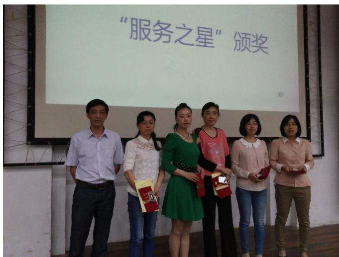
(汪健副馆长为“服务之星”颁奖)