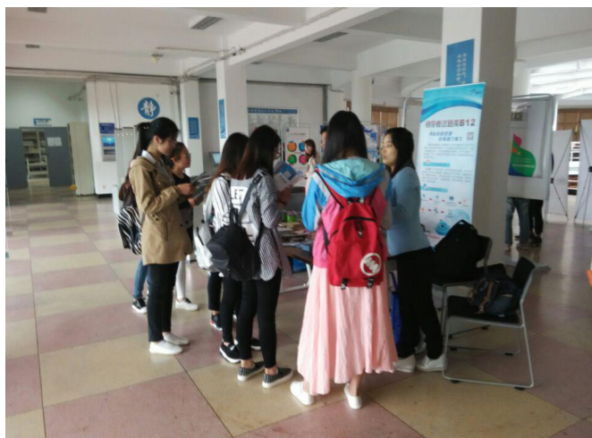
(数字资源宣传活动如火如荼进行中)