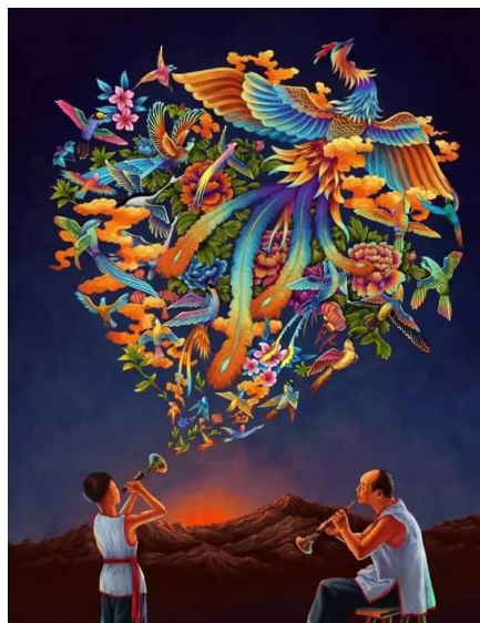
(文学院 15 级汉语言文学 2 班 严欣)

故事的结尾孤独而苍凉，这是社会大背景下一个群体的凄凉，也是唢呐的悲运。如果说在最后还有什么可以带给我安慰的话，我想说的是游天鸣的父亲。游本盛是唯一一个一生都支持游天鸣把唢呐匠这条路走到最后的人，尽管他早在某个黄昏托体于某块土地。可我难忘那个黄昏，那个落日静止在山头，草的须穗摩挲着它的脸面，风翻滚着从山梁上滑下来，让大地变得如此古老而温暖的黄昏。那时候，游天鸣吹出《百鸟朝凤》，不用管连绵不绝的群山，是如何被一杆唢呐搅得撕心裂肺。